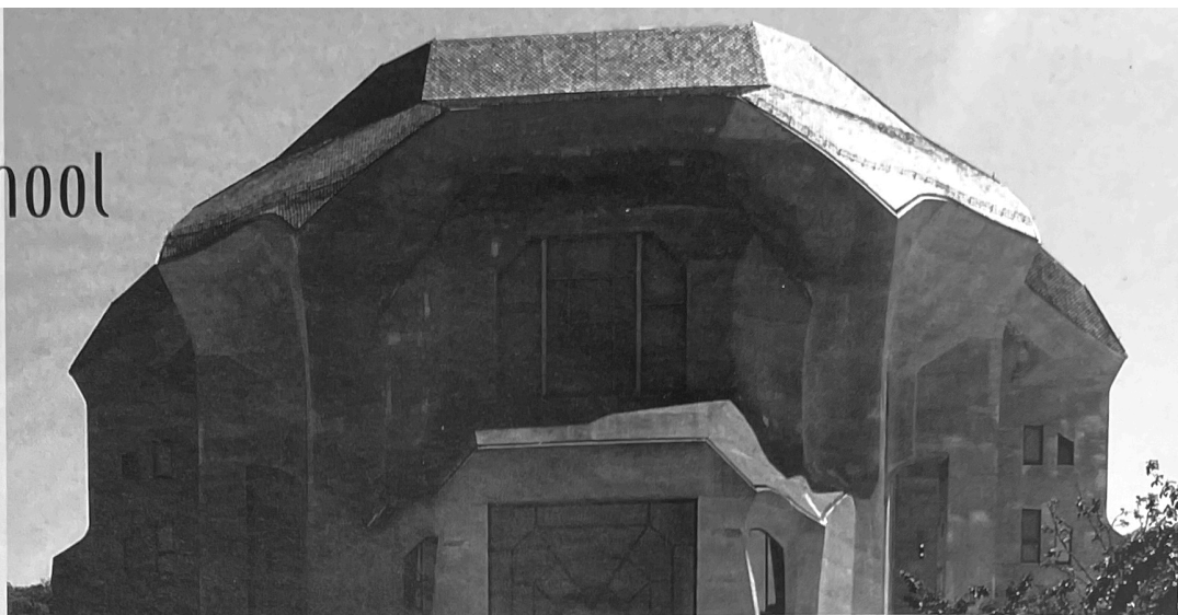
Tweede Goetheanum, westzijde.

Op zoek naar Rudolf Steiners architectuurconcept