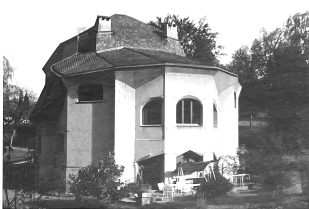
Huis De Jaager, zuidzijde